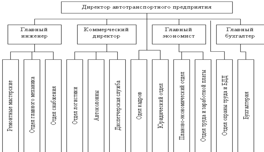
Рисунок 2 – Структура управления автотранспортного предприятия

Текстовые надписи на иллюстрациях рекомендуется заменять главным образом цифровыми обозначениями, которые поясняются в подписи или в основном тексте. Это делается для того, чтобы освободить чертеж, схему от всего лишнего, мешающего увидеть в иллюстрации главное – графически выраженный принцип конструкции, суть строения, явления, процесса. Кроме того, упрощается связь деталей иллюстрации с текстом: цифровые обозначения помогают быстро найти на иллюстрации деталь, упоминаемую в тексте.