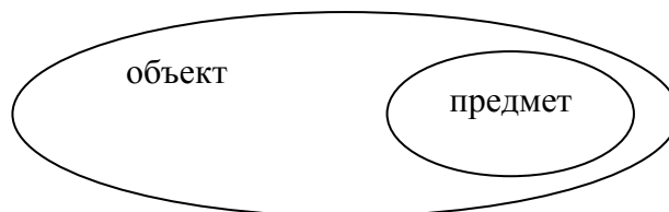
Рисунок 1 – Взаимосвязь объекта и предмета исследования

Предмет исследования – это наиболее значимые с теоретической или практической точки зрения свойства, стороны, проявления, особенности объекта, которые подлежат непосредственному изучению в рамках намечающегося исследования. Это угол зрения на объект, аспект его рассмотрения, дающий представление о том, что конкретно будет изучаться в объекте, как он будет рассматриваться, какие новые отношения, свойства, функции будут выявляться. Предмет, таким образом, отвечает на вопрос: «как рассматривается объект: какие свойства, отношения, функции выделяются в объекте; какая реальность, какая часть объекта будет раскрываться в данном исследовании?».